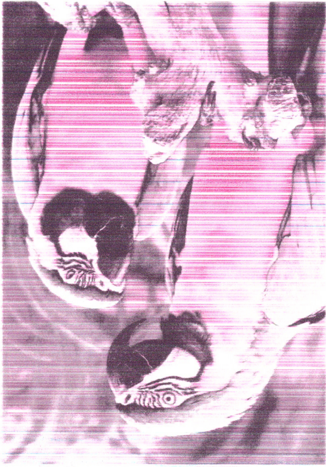
copla - Sistema Cliente - Como llegó