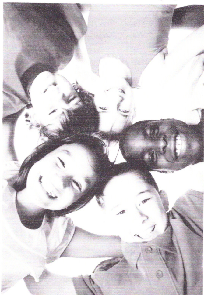
Copia Negro - Sistema prueba.